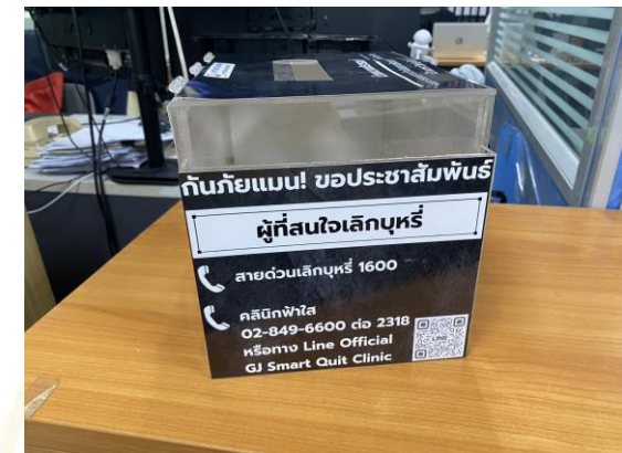
ภาพกล่องตัวอย่าง